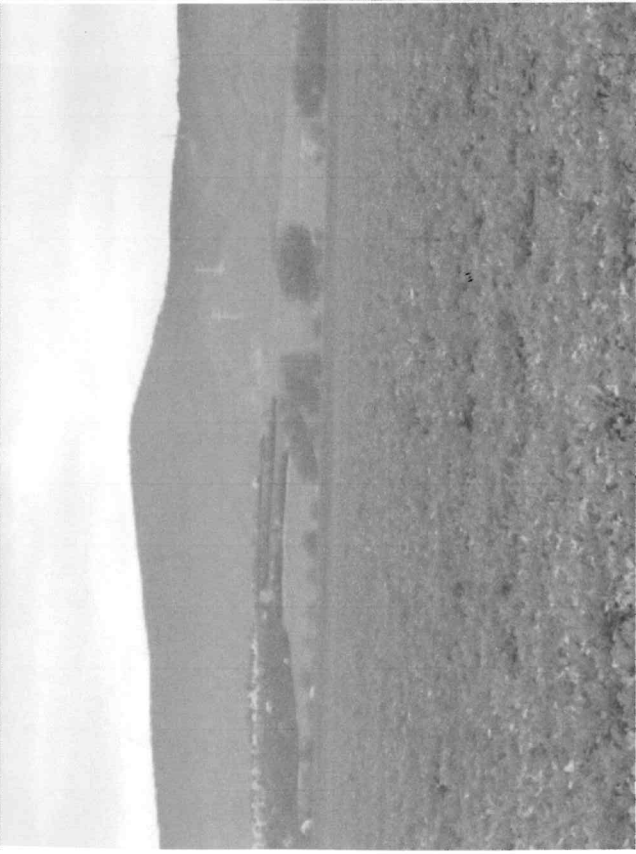
Pozemok KN-C parc. číslo 5111, k.ú Dolné Srnie